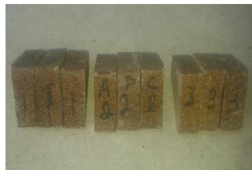
Gambar 1 Spesimen uji