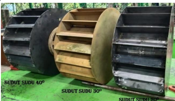
Gambar 5. Turbin Crossflow dengan 3 variasi sudut sudu 20°, 30°, dan 40°

Khusus untuk turbin crossflow yang dibuat pada penelitian ini dengan variasi sudut sudu turbin 20°, 30°, dan 40° dapat dilihat pada gambar 5 berikut: