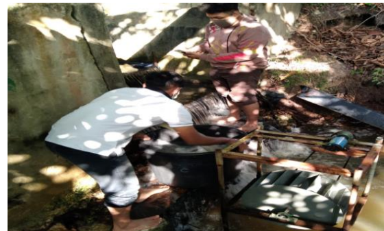
Gambar 6. Proses pembilan data untuk mencari debit air pada aliran danau PCR

Tahap awal penelitian ini dilakukan pengukuran debit aliran danau PCR dengan menggunakan ember kapasitas 0,099 m 3 , dengan menggunakan saluran aliran danau berupa pipa PVC diameter 6 Inchi. Dari 10 kali percobaan rata-rata waktu yang dibutuhkan untuk mengisi air ke ember adalah 4,13 detik. Data lainnya adalah Head sebesar 1,1 m, massa jenis air sebesar 995 Kg/m 3 . Proses Pengambilan data debit aliran danau dapat dilihat pada gambar 6.