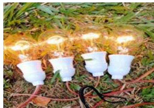
Gambar 7. Hasil Percobaan dengan menggunakan beban 4 lampu pijar.

Data tabel 1, tabel 2, dan tabel 3 diperoleh performance terbaik terjadi pada operasi bal dengan sudut sudu turbin 40° pada pengukuran load 240 Watt (4 buah lampu Pijar), dimana data yang dihasilkan berupa voltage sebesar 185 Volt, Current sebesar 0,78 Ampere, dan pada Rotation Generator sebesar 1.318 rpm dan ke 4 bola lampu pijar menyala dengan baik.