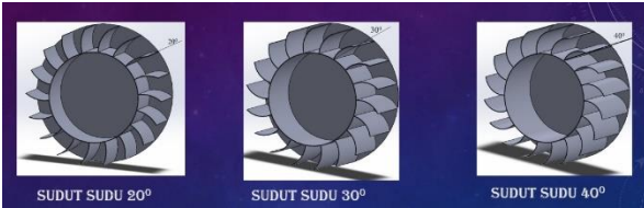
Gambar 3. Variasi sudut sudu turbin crossflow 20°, 30°, 40°

Khusus penelitian ini akan dilakukan variasi sudut sudu turbin crossflow yaitu variasi sudut 20°, 30°, dan 40°. Seperti pada gambar 3.