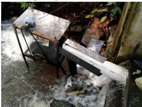
Gambar 4. Pembuatan Mekanik

Pembuatan Mekanik pembangkit listrik pikohidro menggunakan turbin crossflow dengan menggunakan aliran air danau PCR dapat dilihat pada gambar 4.