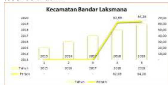
Gambar 8. Nilai Realisasi Penerimaan PBB Kec. Bandar Laksamana 2015-2019 (Sumber: Data Olahan dari Bapenda Kabupaten Bengkalis)

Data PBB-P2 untuk kecamatan Bandar Laksamana dapat di simpulkan dengan tabel berikut ini