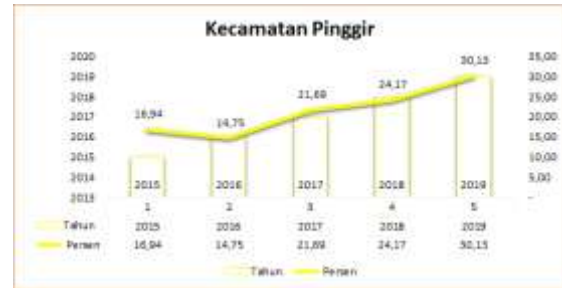
Gambar 7. Nilai Realisasi Penerimaan PBB Kec. Pinggir 2015-2019 (Sumber: Data Olahan dari Bapenda Kabupaten Bengkalis)

Pada Data PBB-P2 kecamatan Pinggir di simpulkan dengan tabel berikut ini.