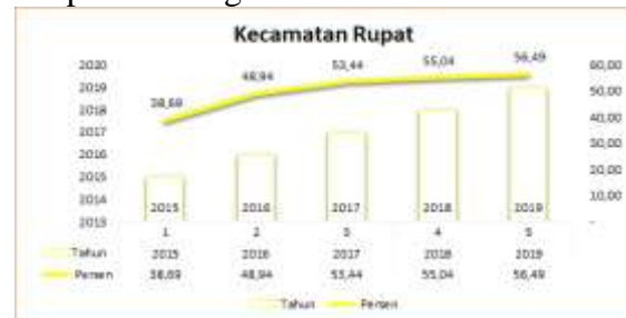
Gambar 4. Nilai Realisasi Penerimaan PBB Kec. Rupa 2015-2019 (Sumber: Data Olahan dari Bapenda Kabupaten Bengkalis)

Selanjutnya Data PBB-P2 untuk kecamatan rupa dapat di simpulkan di simpulkan dengan tabel berikut ini