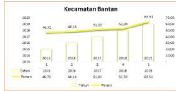
Gambar 3. Nilai Realisasi Penerimaan PBB Kec. Bantan 2015-2019 (Sumber: Data Olahan dari Bapenda Kabupaten Bengkalis)

Data PBB-P2 untuk kecamatan bantan di simpulkan pada tabel berikut ini