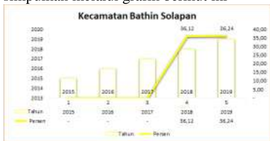
Gambar 10. Nilai Realisasi Penerimaan PBB Kec. Bathin Solapan 2015-2019 (Sumber: Data Olahan dari Bapenda Kabupaten Bengkalis)

Beikut adalah Data PBB-P2 untuk kecamatan Bathin Solapan dapat di simpulkan melalui grafik berikut ini