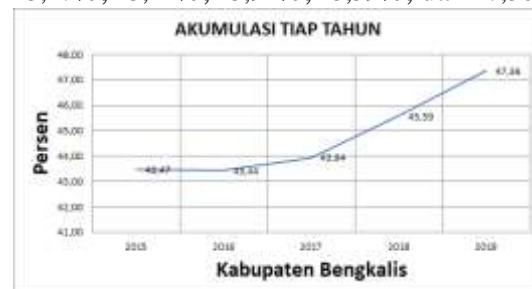
Gambar 12. Nilai Akumulasi Penerimaan PBB Kab. Bengkalis 2015-2019 (Sumber: Data Olahan dari Bapenda Kabupaten Bengkalis)

Tabel untuk laporan pajak 5 tahun dari Data BAPENDA Kabupaten Bengkalis menunjukkan bahwa pada tahun 2015 sampai 2019 realisasi pajak secara kumulatif dibawah 50%. Nilai terealisasi PBB-P2 kabupaten bengkalis pada angka 43,47%, 43,44%, 43,94%, 45,59%, dan 47,36%.