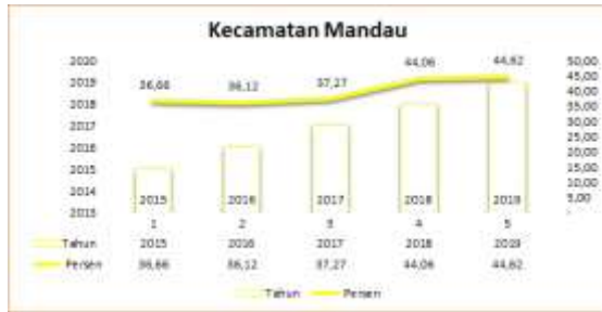
Gambar 5. Nilai Realisasi Penerimaan PBB Kec. Mandau 2015-2019 (Sumber: Data Olahan dari Bapenda Kabupaten Bengkalis)

Progress nilai pajak secara grafik dari jumlah yang terealisasi di kecamatan mandau dibawah 45%, hal ini menunjukkan secara kinerja untuk realisasinya di nilai kurang, dan tingginya tingkat tidak tercapai target realisasi pajak PBB-P2. Nilai tidak terealisasinya PBB-P2 untuk lima tahun berturut-turut dari 2015 s/d 2019 pada angka 36,66%, 36,12%, 37,27%, 44,06%, dan 44,62%.