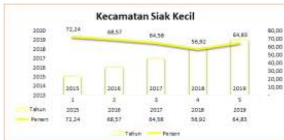
Gambar 1. Nilai Realisasi Penerimaan PBB Kec. Siak Kecil 2015-2019 (Sumber: Data Olahan dari Bapenda Kabupaten Bengkalis)

Berikutnya Data PBB-P2 pada kecamatan siak kecil di simpulkan melalui tabel berikut ini