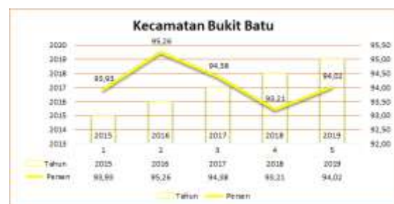
Gambar 1. Nilai Realisasi Penerimaan PBB Kec. Bukit Batu 2015-2019 (Sumber: Data Olahan dari Bapenda Kabupaten Bengkalis)

Data PBB-P2 untuk kecamatan bukit batu dari tabel di atas dapat di simpulkan pada tabel berikut ini