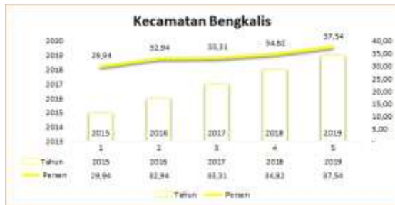
Gambar 6. Nilai Realisasi Penerimaan PBB Kec. Bengkalis 2015-2019 (Sumber: Data Olahan dari Bapenda Kabupaten Bengkalis)

Untu Data PBB-P2 kecamatan Bengkalis dapat di simpulkan dengan tabel berikut ini