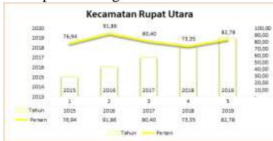
Gambar 2. Nilai Realisasi Penerimaan PBB Kec. Rupa Utara 2015-2019 (Sumber: Data Olahan dari Bapenda Kabupaten Bengkalis)

Selanjutnya Data PBB-P2 untuk kecamatan Rupa utara dapat di simpulkan di simpulkan dengan tabel berikut ini