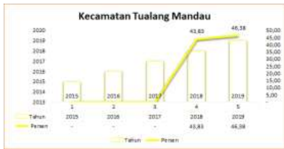
Gambar 9. Nilai Realisasi Penerimaan PBB Kec. Talang Mandau 2015-2019 (Sumber: Data Olahan dari Bapenda Kabupaten Bengkalis)

dari beberapa kecamatan yang bernilai kurang.